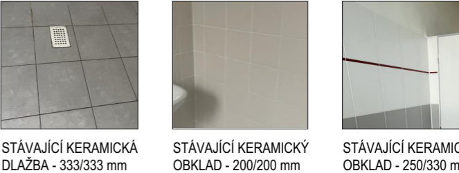
STÁVAJÍCÍ KERAMICKÁ DLAŽBA - 333/333 mm STÁVAJÍCÍ KERAMICKÝ OBKLAD - 200/200 mm STÁVAJÍCÍ KERAMICKÝ OBKLAD - 250/330 mm

POZNÁMKA: - PONECHANÉ DVEŘNÍ KŘÍDLO - VYMĚNIT KLIKU (TYP PŘÍSPŮSOBIT KLIKÁM V JIŽ ZREKONSTRUOVANÝCH HYG. PROSTORECH) - DVEŘNÍ KŘÍDLA MEZI WC A PŘEDSÍNÍ BUDOU ODSTRANĚNA A PONECHÁ SE JEN OTVOR A OCELOVÁ ZÁRUBENĚ - PONECHANOU ZÁRUBENĚ PŘEMALOVAT NA STEJNOU BARVU JAKO JE V JIŽ ZREKONSTRUOVANÝCH HYG. PROSTORECH (ODSTÍN SVĚTLE ŠEDÝ) - V ČÁSTECH STROPU KDE JSOU VIDĚT TRUBKY KANALIZACE PROVÉST ZAPLOPENÍ SDK KONSTRUKCÍ POUZE LOKÁLNĚ TAK, ABY SE VŽDY VYTVOŘIL JEDEN SOUVISLÝ SDK ZÁKLOP.